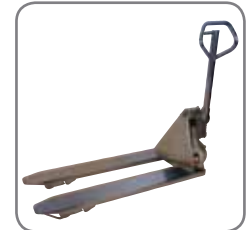
Panther Inox Plus ist auch in explosionsgeschützter Ausführung erhältlich.