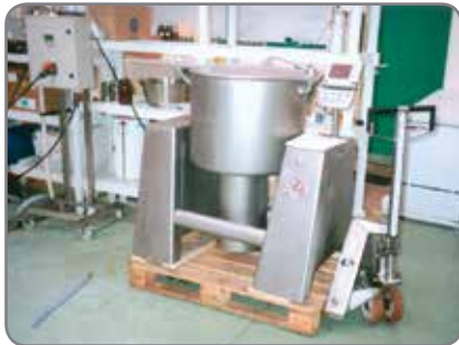
Inox Plus - für die Lebensmittel- und Pharmaindustrie mit hohen Ansprüchen an Hygiene und Reinigung.