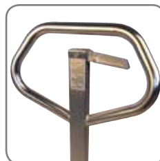
Ergonomische Deichsel sorgt für einen entspannten Griff.