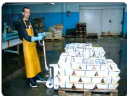
Inox - für die Lebensmittelindustrie in den Gebieten, wo Korrosionsbeständigkeit wichtig ist.